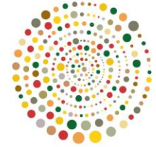
Figura 1: Eixos de intervenção a nível interno/organizacional.

As linhas Orientadoras dos eixos de Intervenção são: