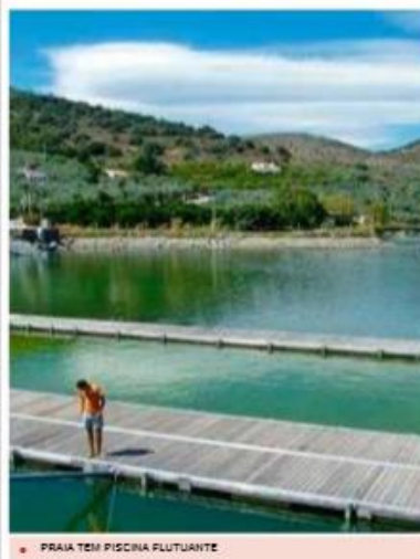
PRAIA TEM PISCINA FLUTUANTE

É em Freixo de Espada à Cinta, num pequeno concelho, junto à fronteira espanhola, que se encontra mais uma maravilha transmontana. A Praia Fluvial da Congida, situada na albufeira formada pela Barragem de Saucelle, é um dos espaços mais apetecíveis do Douro. Com galardão de qualidade da bandeira