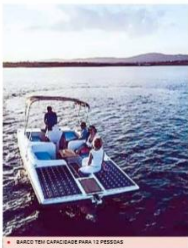
BARCO TEM CAPACIDADE PARA 12 PESSOAS

Movido a painéis solares, o Vitinho leva-nos a descobrir os lugares, até agora desconhecidos, da paisagem protegida da Albufeira do Azibo. Inserido no projeto Sun Azibo Cruzetros, este barco, com capacidade para 12 pessoas, realiza programas com o objetivo de explorar a envolvente paisagística e natural de toda a albufeira, permitindo ainda que os visitantes possam fazer refeições a bordo, captar imagens ou dar um mergulho. É a primeira vez que uma embarcação de recreio está a operar nas águas do Azibo.