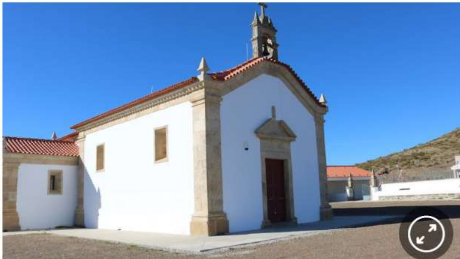
Santuário do Santo Antão da Barca, localizado no concelho de Alfândega da Fé.

Candidatura reúne quatro municípios do Baixo Sabor e vai abranger 16 igrejas e capelas, que serão intervencionadas. Está também prevista a criação um centro interpretativo em Macedo de Cavaleiros.