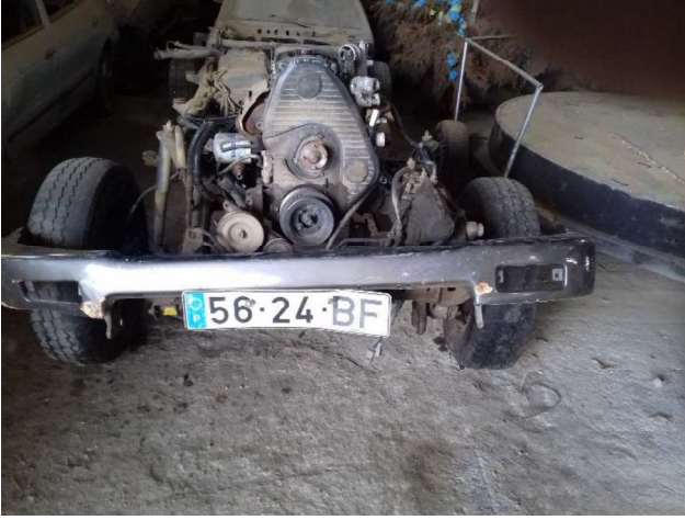
Chassi Toyota Hilux (56-24-BF)