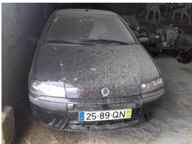
Fiat Punto (25-89-QN)