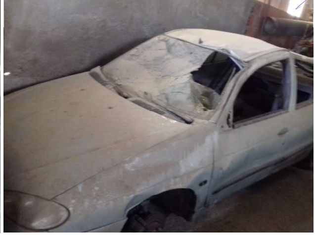
Renault Megane (75-73-OI)