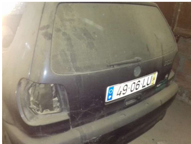
volkswagen Polo (49-06-LU)