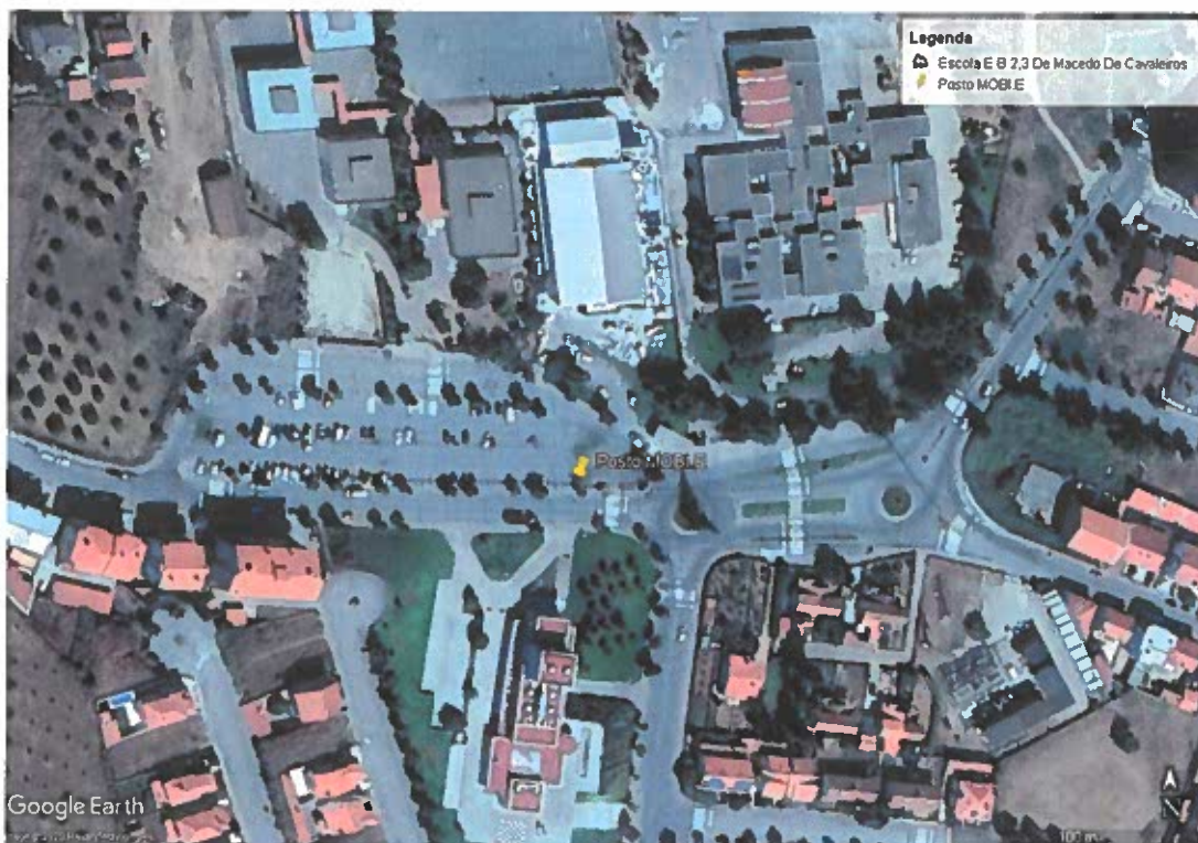
Figura 1: Localização Posto MOBI.E em Macedo de Cavaleiros; Fonte: Google Earth (2020).